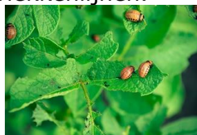
Coloradokever - Eitjes - Larven

De coloradokever heeft geen natuurlijke vijanden, dus vangen en vernietigen is de enige optie.