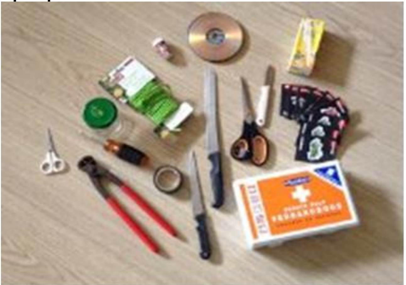
Foto: gevonden voorwerpen die op zoek zijn naar hun echte eigenaar!

Op de foto is zichtbaar wat er is gevonden. Indien u een voorwerp herkent die van u is, dan kunt u contact opnemen met de secretaris via de telefoon 055-5421203 of het e-mailadres: secretariaateav@hotmail.com